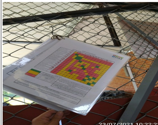
Foto 2: Condiciones operativas de almacenamiento: Matriz de compatibilidad de residuos y Hojas de seguridad, ausencia de registros de recepción y despacho.