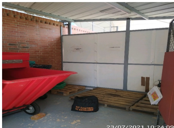
Foto 1: Área de almacenamiento de residuos peligrosos, ubicada al respaldo de la plaza cinco en el centro de acopio.